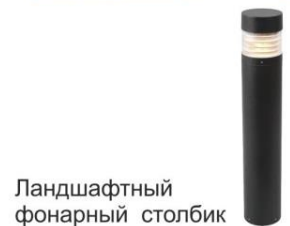
Ландшафтный фонарный столбик