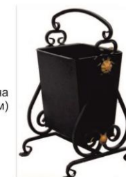
Урна (700 мм)