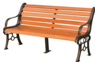
Рис.2. Парковая скамья